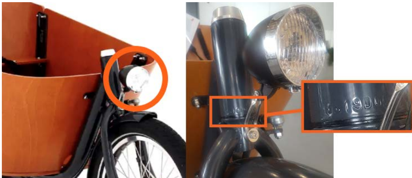
Vorderrahmen, Lenkkopflager Rad

Die Nummer des Vorderrahmens ist auf dem Lenkkopflager (Abbildung Vorderrahmen Lenkkopflager) Ihres Lastenfahrrads zu finden. Jede Rahmennummer beginnt mit GB1 gefolgt von einer Ziffern- Buchstabenkombination, z.B. GB17A. (nur wenn Vorderrahmen eingegeben werden muss)