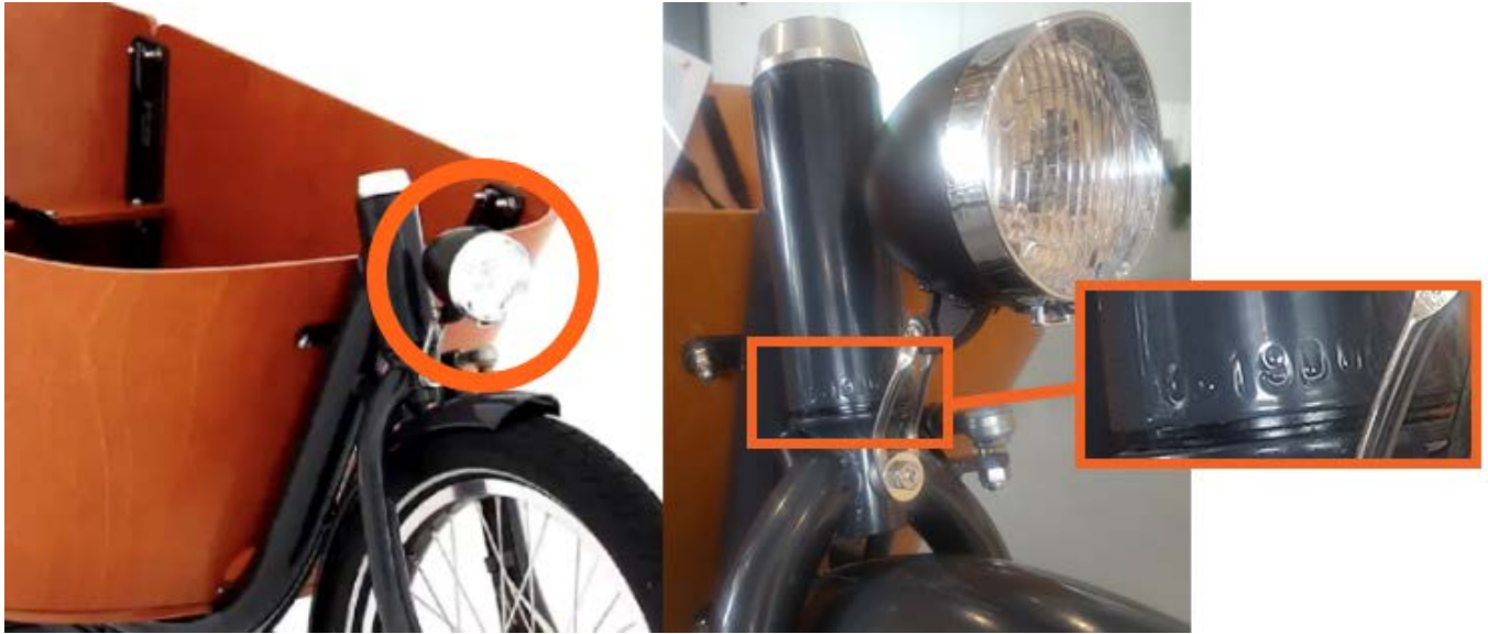
Front frame, steering head bike

The number of the front frame can be found on the steering head (image front frame steering head) of your cargo bike. Each frame number starts with GB1 followed by a number and letter combination. For example, GB17A. (only necessary when you have to enter your front frame number)